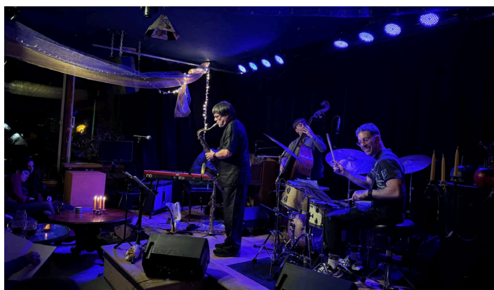
Festival Maski-Jazz, Saint-Gabriel

Cette initiative a obtenu un soutien financier du Programme de développement d'initiatives culturelles proposé par la MRC et le MCC.