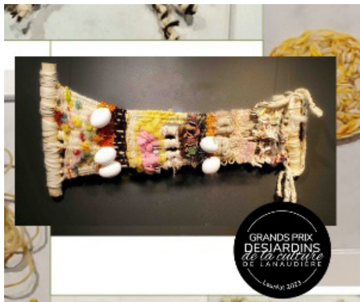
L'oeuvre Fibres D'Autray réalisée par Marcelo Martins pourra être appréciée lors des ateliers.

Marcelo animera également des ateliers à la bibliothèque de Berthierville les 18 janvier, 15 février et 15 mars 2025. Ces séances accessibles à tous mettront en lumière les fibres locales québécoises et les savoir-faire traditionnels.